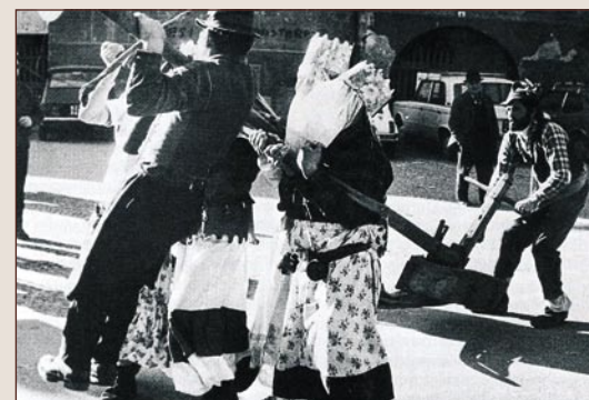
“Chi che ara”: gli zane e l’aratro, Predazzo 1976. Da D. Baiocco, Carnevali in Val di Fiemme, UCT, Trento, 1995.