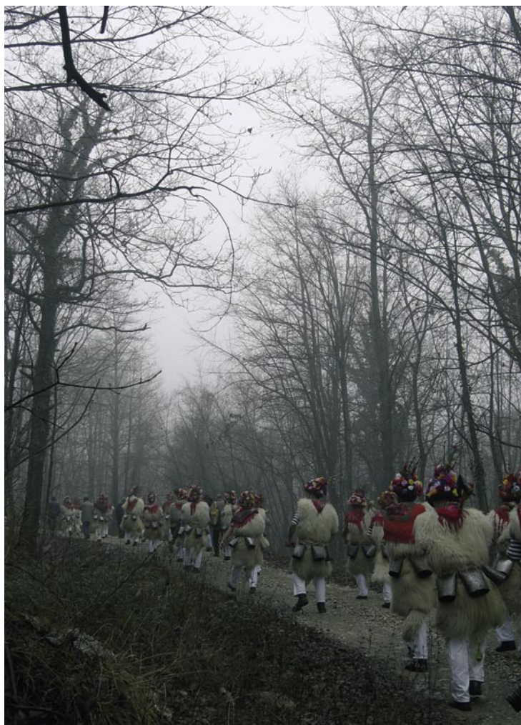
Zvončari nel lungo corteo di questua, 20 gennaio 2008.