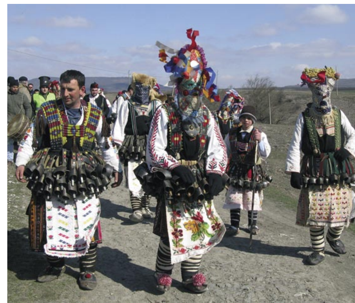
Kukeri, 17 febbraio 2008.

Il villaggio di Chelnik presso Jambol, al centro delle grandi pianure della Tracia, partecipa della tradizione dei kukeri , diffusa in tutta la Bulgaria centro-orientale. In corrispondenza del carnevale ortodosso, che è solitamente un po' più tardivo di quello cattolico, gruppi mascherati di giovani resi irriconoscibili da mascheramenti molto elaborati, accompagnati da qualche suonatore zingaro e da un codazzo di maschere buffonesche, compiono un giro di questua che abbraccia tutto il villaggio, dalla mattina fino all'imbrunire. In ciascuno dei cortili domestici che vengono visitati si eseguono una danza e alcuni altri semplici riti di buon augurio, e si raccolgono offerte di vino, uova, dolci, salumi e altri cibi. A fine giornata i kukeri si radunano sulla piazza, dove descrivono con un girotondo un ampio cerchio rituale. All'interno di questo cerchio ha luogo la rappresentazione di uno sposalizio officiato da un finto prete (la sposa è generalmente un uomo), la prima condivisione del cibo tra gli sposi , l' aratura e la semina rituali, con l'aratro condotto dalla sposa stessa, il parto semiserio di una bambola o di un gatto vivo, e un augurio rituale pronunciato a gran voce dalla sposa in piedi sull'aratro rovesciato.