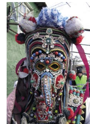
Maschera kukeri, 17 febbraio 2008.