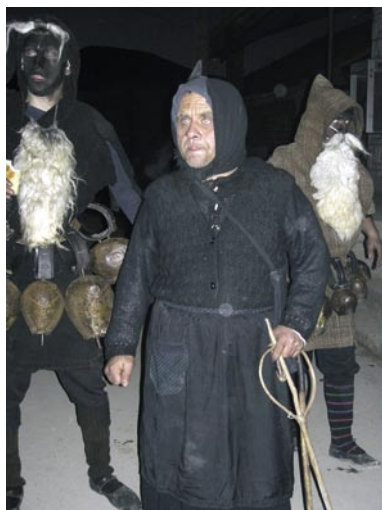
«Vecchia», 14 gennaio 2007.