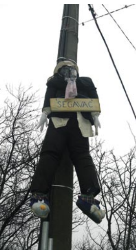
Pust, villaggio di Segavac, 20 gennaio 2008.