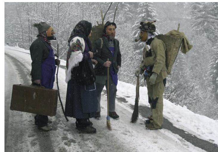
Paiaci, carnevale 2006.