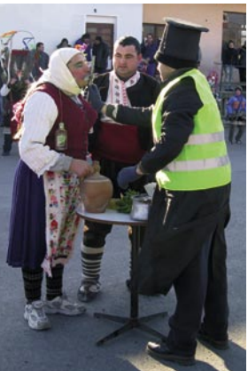
Matrimonio kukeri, 17 febbraio 2008.