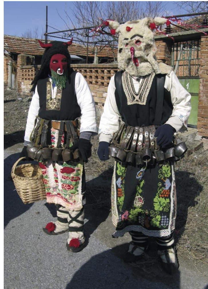
Parto kukeri, 17 febbraio 2008.