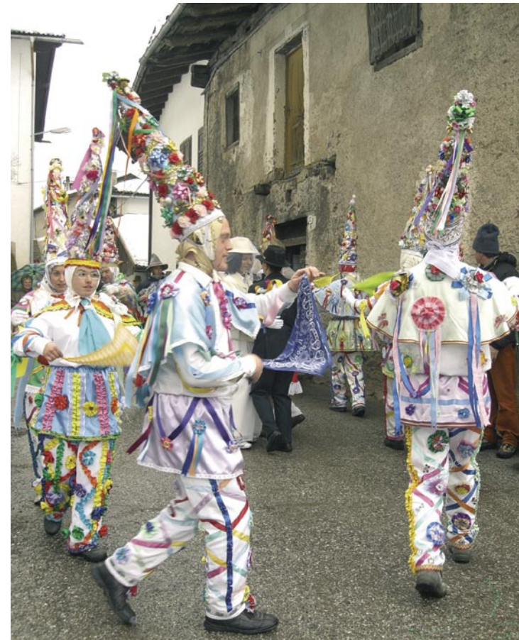
Arlechini, carnevale 2006.