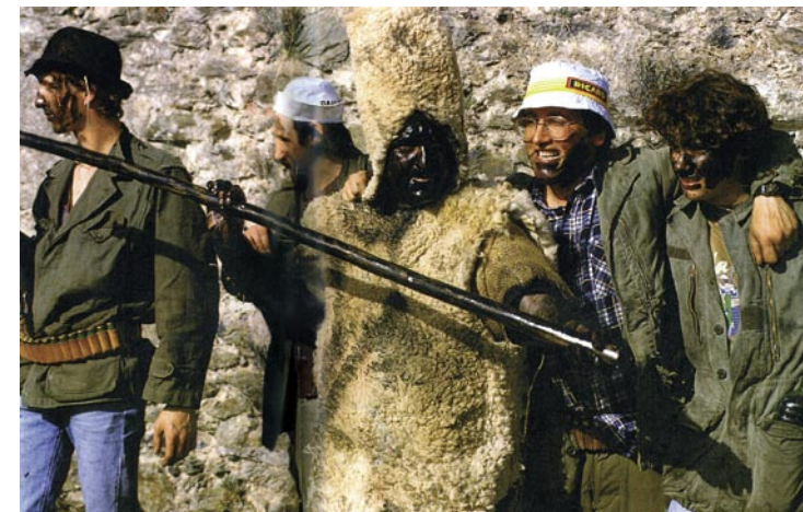
Orso e cacciatori. Da B. de Villaines, G. d'Andlau, Carnavals en France, Fleurus, Paris, 1996.