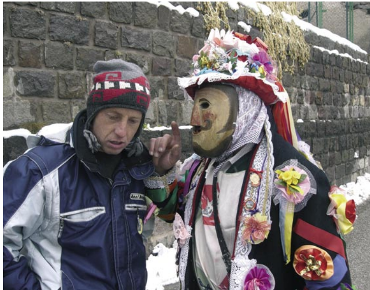
Contrèst, carnevale 2006.

Tre tipi di figure si susseguono nel corteo. Per primi i matòci o barbi mascherati, scampananti e vocianti, cui i paesani oppongono breve resistenza intrecciando dei vivaci contrèst verbali. Seguono, con i sonadóri , gli arlechini danzanti, a volto scoperto sotto un'alta capucia conica, che accompagnano ieratici e silenziosi la coppia degli spòsi . Infine i paiaci , con una sequela di mute pantomime ridanciane, straccione e burlesche. La sequenza delle tre diverse rappresentazioni si ripete con uguale cadenza in ciascuna delle frazioni visitate, dove l'arrivo delle maschere è oggi salutato dall'offerta di vino, frittelle e altri cibi.