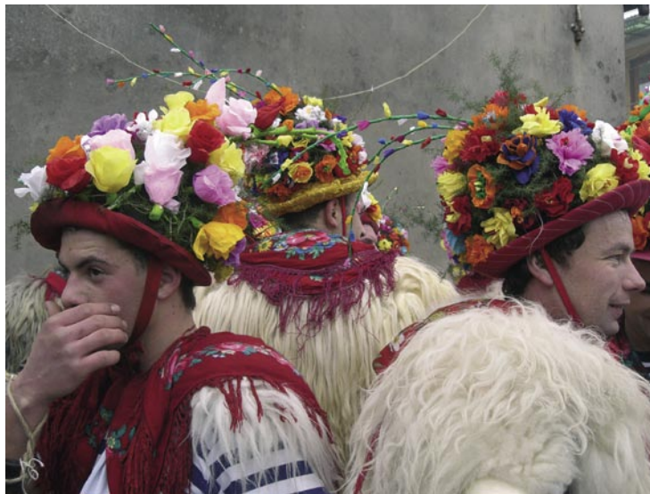
Zvončari, 20 gennaio 2008.

Cominciano a formarsi verso il 1930 nell'entroterra di Rijeka/Fiume le moderne compagnie paesane degli zvončari , o «scampanatori», che una volta si chiamavano gli stari , i «vecchi». A quella stessa epoca si deve anche la stilizzazione del costume, che è per un terzo pastorale (il campano, la pelle di capro, la mazza), per un terzo carnevalesco-cerimoniale (il cappello fiorito), e per un terzo marinaresco (la maglia a righe bianco-azzurre dei barcaioli del Quarnero). Oggi circa una quarantina di gruppi sono impegnati per tutto il periodo di carnevale – segnalato da un fantoccio detto pust appeso all'ingresso dei paesi – in una serie di giri di questua, che abbracciano anche le più minute frazioncine. In ciascuno dei paesini visitati gli invasori scampananti, guidati da una sorta di araldo che imbraccia una lunga canna, e seguiti dai musicanti, si stringono con grande intensità in una spirale che culmina in un fittissimo grumo di corpi, per poi subito disperdersi e dar vita a una piccola sagra.