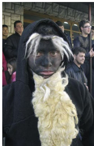
Djolomar, 14 gennaio 2007.