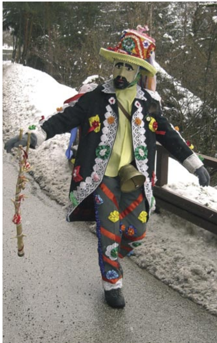
Matòcio, carnevale 2006.

Anche a Prats-de-Mollo-la-Preste, nella Catalogna francese, il carnevale è annunciato dall'invasione di esseri spaventosi e selvaggi, i cosiddetti orsí , vestiti di pelli di montone con un lungo copricapo conico di pelle ovina, il viso e le braccia coperte di nerofumo molto unto, e tra le mani un lungo bastone sudicio e nero. Così conciati, si lanciano dall'alto della selva all'inseguimento delle paesane e dei paesani, cui cercano imbrattare il viso con ampie manate di nerofumo. Il loro ingresso in paese è però contrastato dai cacciatori lanciati al loro inseguimento, che alla fine ne mimano l'abbattimento con dei colpi a salve di moschetto. A questo punto fanno il loro ingresso degli «uomini in bianco» ovvero dei barbieri più ieratici e composti che recano lunghe catene per imbrigliare gli orsí , oltre a piccole accette e a caraffe di vino. Incatenati gli orsí , questi vengono condotti sulla piazza, dove si procede con il vino e le lame delle accette a una loro «rasatura» cerimoniale. Solo a questo punto ha inizio il ball de correr e dunque il carnevale vero e proprio, che continuerà con i suoi figuranti buffoneschi per tutto il giorno successivo.