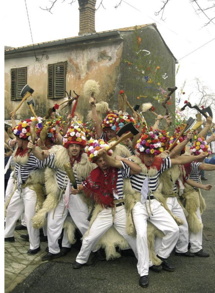
Zvončari, 20 gennaio 2008.