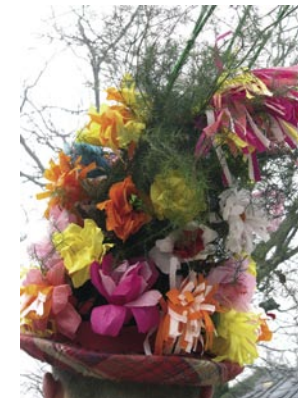
Cappello di zvončar, 20 gennaio 2008.