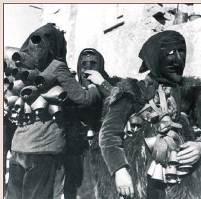
Mamuthones, Mamoiada , 1957. Da AA.VV., Il Carnevale in Sardegna, 2D Editrice Mediterranea, Cagliari, 1989.