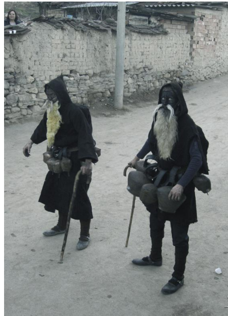
Djolomar, 14 gennaio 2007.