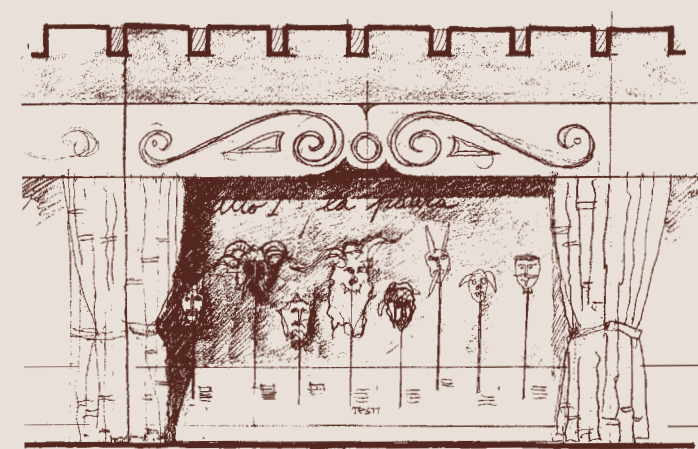
PROSPETTO TIPO 1:25 FRONTE SUD